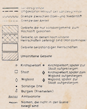
Das Fürstbistum Münster 1498/99

Entwurf: J. Hartig auf Grund der Schatzungslisten und in Anlehnung an die Karten „Die westfälischen Länder 1801“ (S. Wrede) und „Die westfälischen Länder um 1550“ (W. Lesocki)